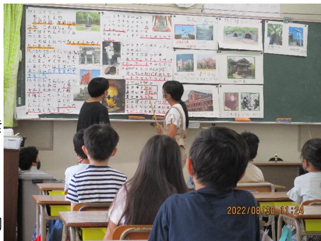
【6年生の説明を真剣に聴く1年生】

このように天神山小学校では、学年間での交流を大切にする学習も年間を通して進めています。