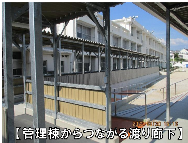
【管理棟からつながる渡り廊下】

プール横に新校舎が完成しました。前期後半から、ひまわり5・6・7組が入っています。新校舎に入ってひとつめの教室では、最新のプロジェクターを使って、外国語活動の授業等も計画をしているところです。